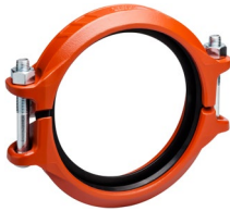
2 – 12"/DN50 – DN300