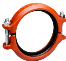
2 – 12"/DN50 – DN300