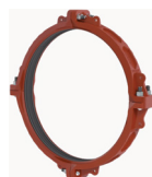
W77B Tamaños de 52 – 72"/DN1300 – DN1800 Patentadas