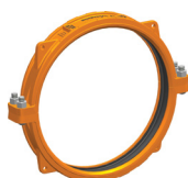
W77 Tamaños de 26 – 50"/DN650 – DN1250 Patentadas