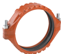
W77 Tamaños de 14 – 24"/DN350 – DN600 Patentadas